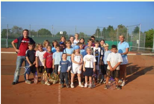
Jugendcamp, Sommerferien 2006